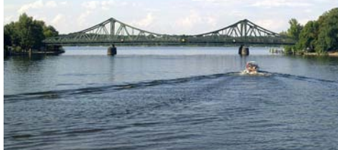
Die Glienicker Brücke zwischen Berlin und Potsdam aus Havel-Perspektive

Was als grosses Bürgerfest in der brandenburgischen Landeshauptstadt geplant war, vereitelt ein kleiner Virus. Doch Not macht erfinderisch und verleiht dem diesjährigen Tag der Deutschen Einheit mit der Idee einer „Einheits-Expo“ seine spezifische Note. Unter dem Motto „30 Jahre - 30 Tage - 30 x Deutschland“ präsentieren 30 Exponate unter freiem Potsdamer Himmel deutsche Länder und Institutionen im 30. Jahr wiedererrungener Einheit. Die weiträumig im Stadtzentrum inszenierte Ausstellung ist roter Faden für einen anregenden Spaziergang im Kontrast innovativer Installationen vor historischer Kulisse, die Einheit und Vielfalt Deutschlands spiegeln. Das Konzept ersetzt zwar kein Fest, erlaubt aber einen gemeinsamen Feiertag, der auch in gebotener Distanz gefeiert werden muss.