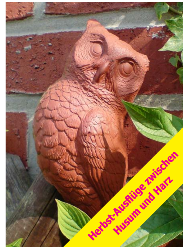
Auf dem Töpferhof Hohenwoos