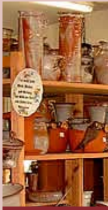
Der Töpferhof in Hohenwoos

Fahrt durch das Wendland über Dannenberg nach Dömitz. Die Festungsanlage Dömitz , gelegen am mecklenburgischen Elbeufer ist eine der wenigen sehr gut erhaltenen Flachlandfestungen des 16. Jahrhunderts in Norddeutschland und ist in erster Linie ein stadsgeschichtliches Museum mit einer vielseitigen und interessanten Ausstellung über den historischen Entwicklungsweg der Stadt vom 17. Jahrhundert bis in die Gegenwart. Möglichkeit zur Besichtigung und Weiterfahrt in die mecklenburgische "Griese Gegend" zum Töpferhof